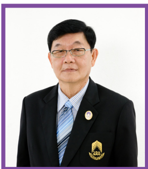
ศ.(พิเศษ) ดร.มณฑล สงวนเสริมศรี อธิการบดีมหาวิทยาลัยพะเยา